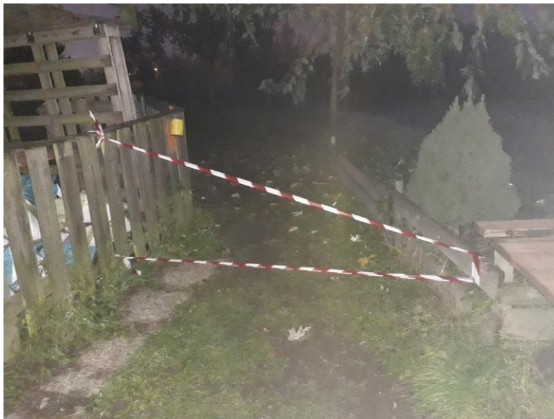
Durchgang gesperrt – hier könnte nicht der notwendige Abstand gewährleistet werden

Österreichischer Rassehundeverein (ÖRV) Hundesportverein – Wien – Hundeschule Breitenlee