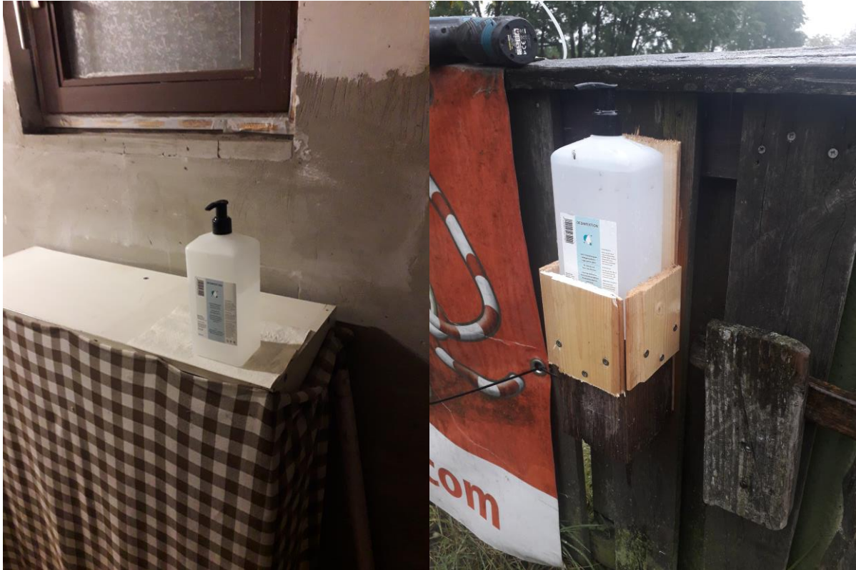
Spender im Waschraum/WC sowie Spender neben Eingang zu den Parcours

www.hundeschule-breitenlee.at / office@hundeschule-breitenlee.at