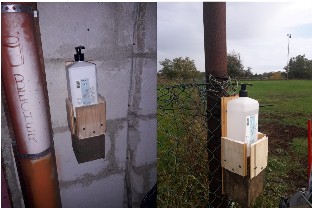
Spender neben dem Eingang zum Vereinshaus / Spender am großen Unterordnungsplatz

Neben dem Eingang zum Vereinshaus / in den WC-Anlagen / beim Eingang zum Trainingsgelände / am großen Unterordnungsplatz → siehe Fotos: